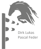
Dirk Lukas Pascal Feder

1. Stechen über: 7-8-15-4a-4b-6-16-10 Bahnlänge: 390 mtr. Erlaubte Zeit: 63 sek. Höchstzeit: 126 sek.